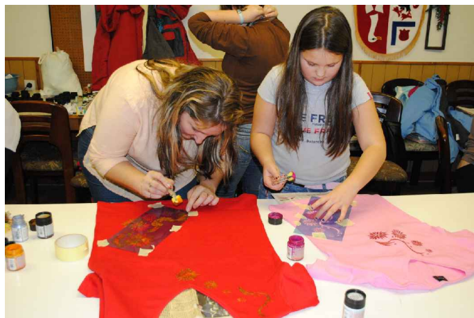
Aplikace na trička