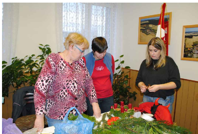
Výroba adventních věnců a štol

Zveme Vás na tyto výtvarné dílny, které pokračují také v roce 2011: