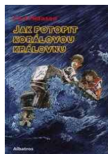
Jak potopit Korálovou královnu Carl Hiaasen